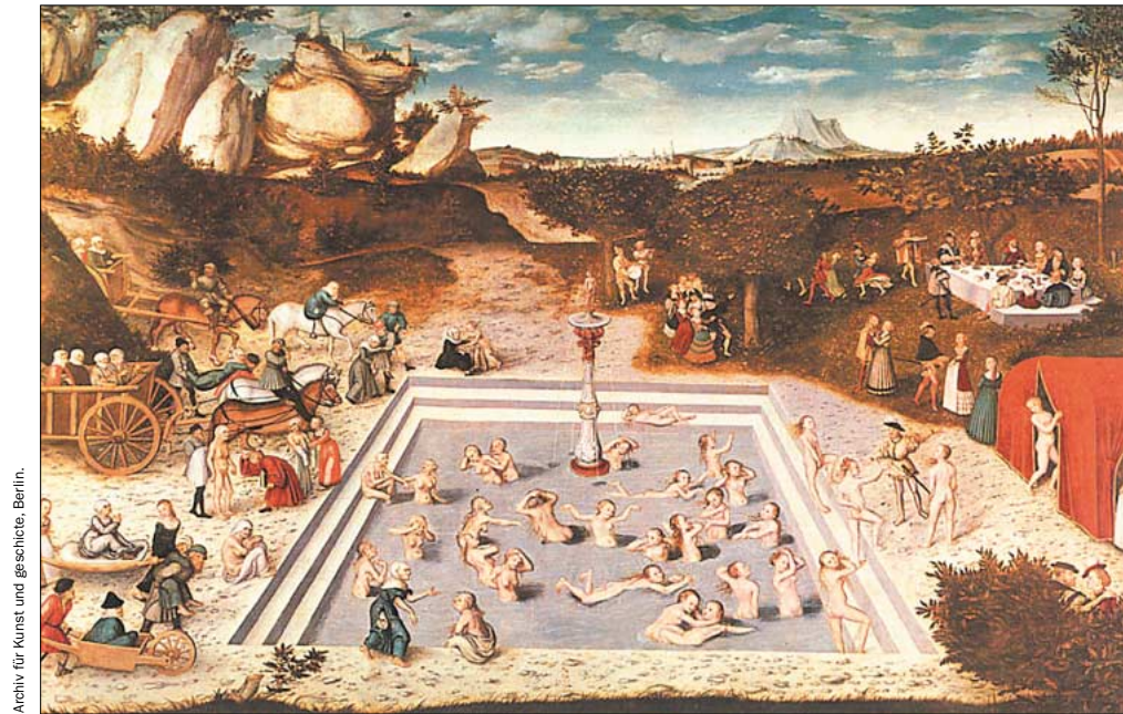
Archiv für Kunst und Geschichte, Berlin.

Jagten på ungdommens kilde har optaget mange mennesker gennem tiden. Også i dag tilbydes der mange forskelligartede behandlinger mod alderdom. Men hvor langt er man egentlig nået i kampen mod alderen?